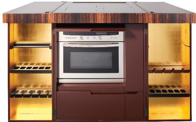
Élément de cuisine “Blossom” conçu par Norbert Brakonier et Karl-Heinz Thesen, fabriqué par Unikat Interior