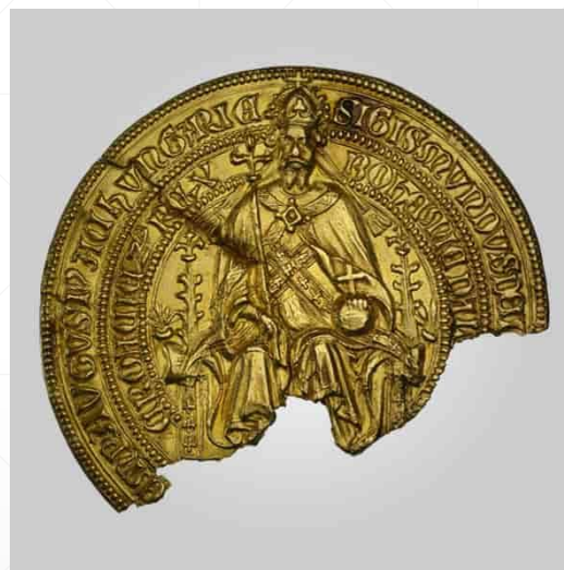
Cabinet des Médailles