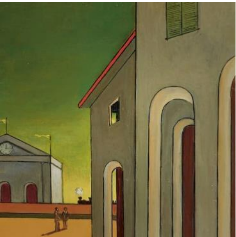
Art moderne et contemporain