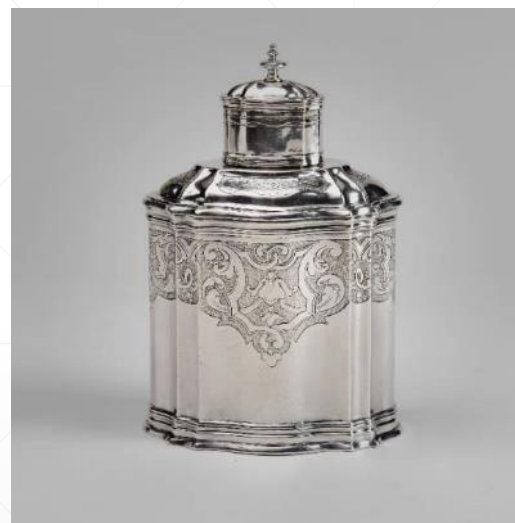
Arts décoratifs et populaires