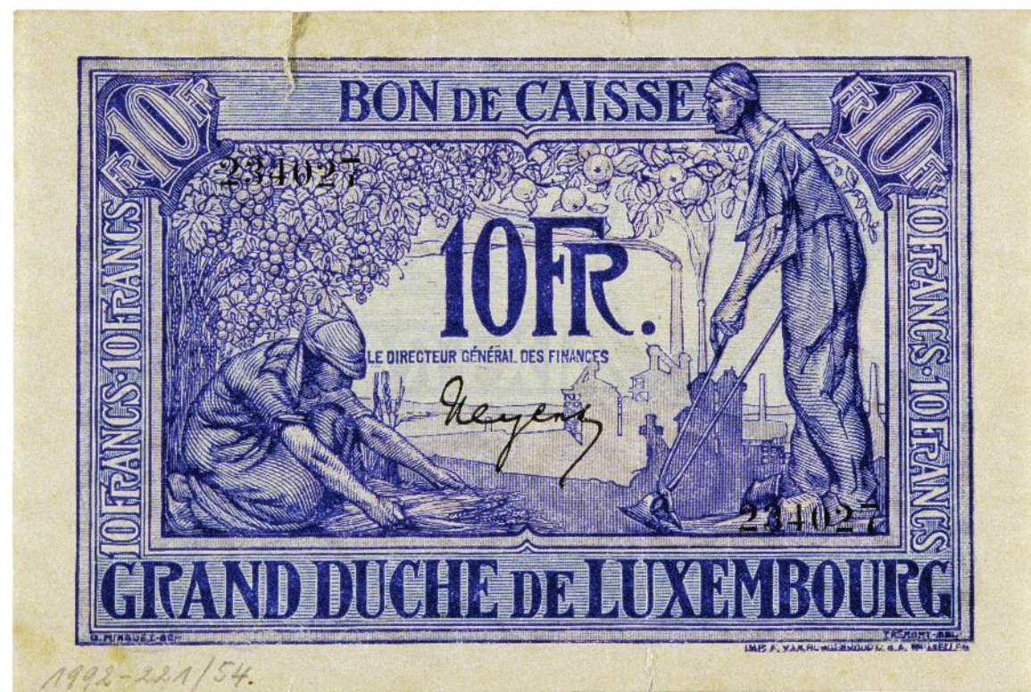
Billet imprimé à Bruxelles par F. van Buggenhoudt Gravé par Guillaume Minguet