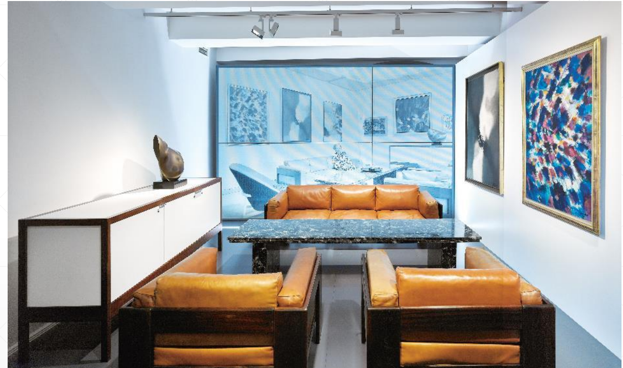
Ensemble de meubles de salon des années 60