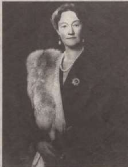
Mit unerschütterlicher Beharrlichkeit verkörperte Großherzogin Charlotte die Luxemburger Identität in der dunkelsten Stunde des Landes.

Die Dokumentation bietet Einblick in das Leben einer markanten politischen Persönlichkeit, die den Bogen zwischen Vergangen-